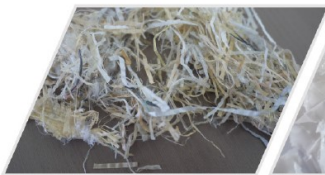
PP Jumbo bag