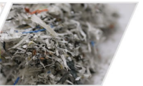
PP woven bag